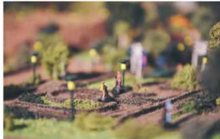
Den som vill lära sig köra segway kan göra det på två olika banor. Extremt mycket arbete har lagts ned på modellen.