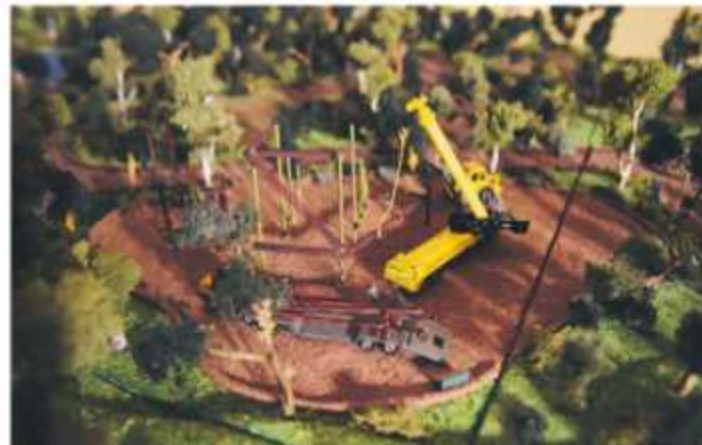
Nästa år ska det här bli en dinosauripark för småkryp.